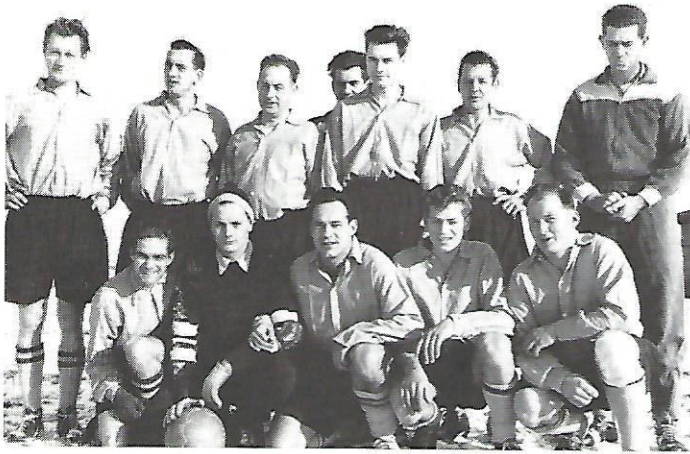
Die harten Kämpen der 50 er Jahre

das Theaterstück «Dr Tubehannes» einstudiert. Erstmals unternahm der Verein einen Maibummel mit den Familienangehörigen ins Dählhölzli. Das Jahr verlief ruhig, und kleine Höcks festigten das Zugehörigkeitsgefühl unter Aktiven wie Passiven.