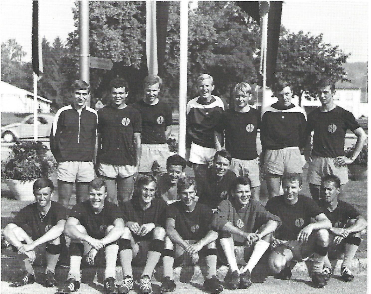
Diese Mannschaft errang 1967 den Titel eines schweizerischen PTT-Fussballmeisters in Schaffhausen