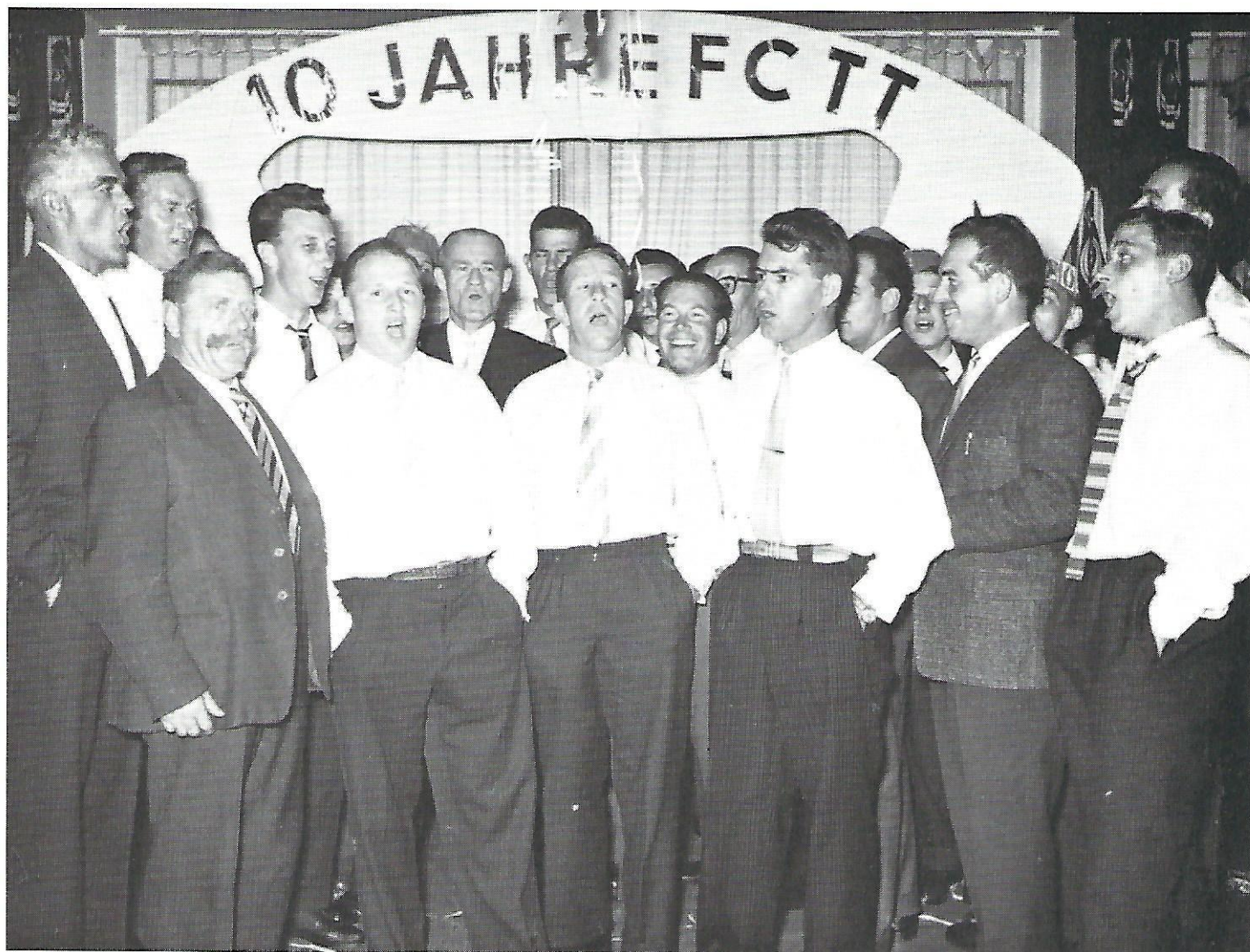
1959 – Der FC TT Bern feierte sein 10jähriges Bestehen